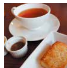
19種類の銘柄の紅茶が楽しめます。お好みの味を見つけてみてください。

A 子供の頃から朝食はいつもパンと紅茶が食卓に並んでいました。そのため、自然とパンや紅茶が好きになり、いつしか好きなことで商売をしてみたい気持ちが強くなったため、会社員を辞めて創業を決めました。