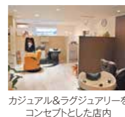
カジュアル&ラグジュアリーをコンセプトとした店内

A 高校生の頃、友人の髪を切ったことがあり、周りに「上手!」と褒められたことがきっかけで美容師に興味を持ち、いつしか美容師になることが夢となりました。豊田の他に東京でも修業し、念願叶って創業に至りました。