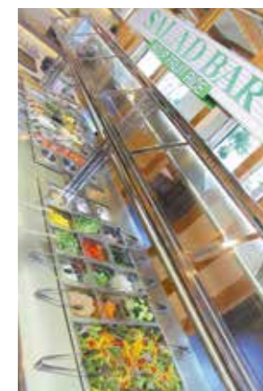
38種類のサラダバー!