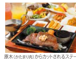
原木(かたまり肉)からカットされるステーキ