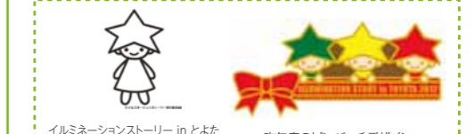
イルミネーションストーリー in とよたイメージキャラクター「イルミちゃん」 昨年度のピンバッチデザイン

その他応募条件等についてはHPをご覧ください。TEL:0565-32-4595までお問い合わせください。