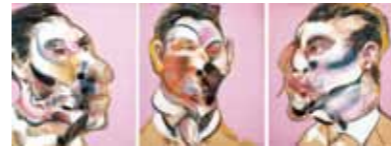
《ジョージ・ダイアの三習作》1969年 ルイジアナ近代美術館蔵

ペーコン自身の語る「あらゆる感情のバルブが解放する」強烈な絵画とはいかなるものか。ぜひ体感してください。