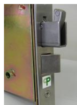
鎌状デットボルト