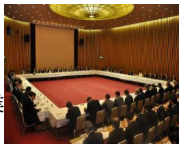
25人の日本国大使等が出席した