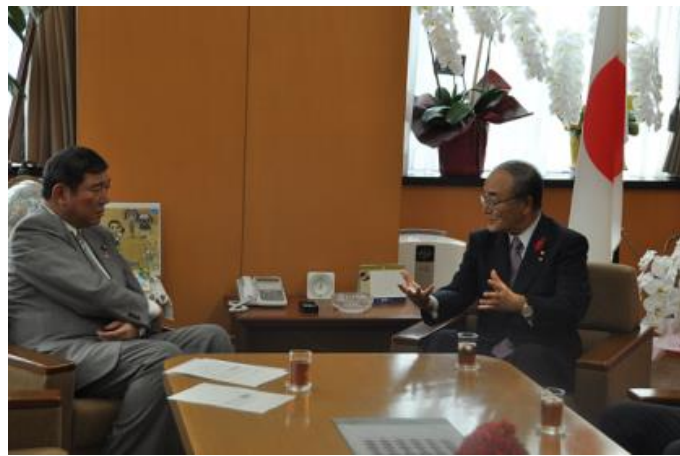
石破地方創生担当大臣と意見を交換する三村会頭(右)

石破大臣は、「国が地方に何かをしてあげるのではなく、地方のことは、地方で突き詰めて考えることが必要。「まち」をどうしていくのかは、民間から意見を出してもらいたい。地方から文化を変えていかなければならない」と述べた。