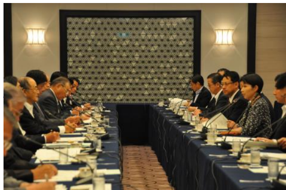
小淵経産相(右)との懇談会では活発な意見交換が行われた

低廉な電力の安定供給の早期回復を求めるとともに、「中小企業は電力料金上昇分を転嫁できていない」と述べ、安全が確認された原発の早期再稼働を求めた。