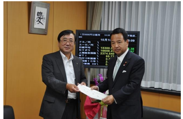
甘利経済再生担当大臣に意見書を手交する中村専務理事

意見書では、急激に進む人口減少を放置すれば、日本の経済社会には極めて困難な未来が待っており、政府・地方自治体・国民等の各層が危機意識を共有し、人口急減という中長期的課題の解決に取り組む必要があると強調。特に、地方の疲弊と人口減少は、表裏一体の関係にあり、地方の人口急減、都市部や東京への人口流出に歯止めをかけ、日本全体が経済の縮小スパイラルから脱却し持続的な成長を遂げていくためには、地域の創生・再生が最も有効かつ重要な対策と指摘。